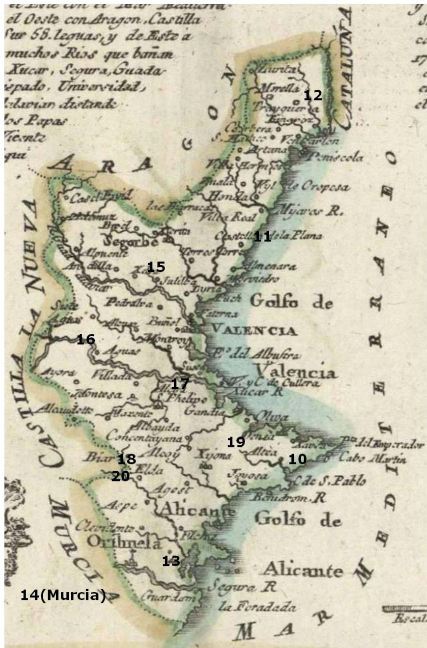
Fig.4 (Elaboración propia a partir de un mapa recogido en López 1757): 10. Játiva (2 de agosto de 1607), 11. Castellón (2 de junio de 1608), 12. San Mateo (11 de junio de 1610), 13. Orihuela (8 de enero de 1611), 14. Murcia (21 de junio de 1616), 15. Jérica (4 de enero de 1619), 16. Caudete (28 de abril de 1635), 17. Alberique (16 de septiembre de 1698), 18. Biar (18 de marzo de 1716), 19. Callosa d'En Sarriá (17 de enero de 1721), 20 Monóvar (25 de diciembre de 1729).