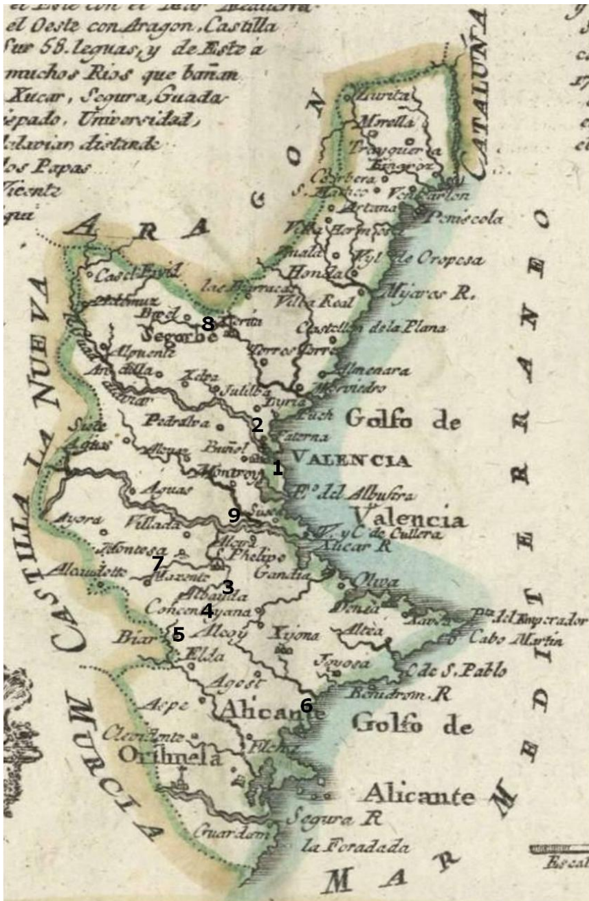
Fig.1 (Elaboración propia a partir de un mapa recogido en López 1757): 1. Valencia (24 de octubre de 1596), 2. Masamagrell (26 de abril de 1597), 3. Albaida (25 de enero de 1598), 4. Onteniente (19 de febrero de 1598), 5. Biar (1598), 6. Alicante (19 de noviembre de 1599), 7. Ollería (27 de mayo de 1601), 8. Segorbe (25 de julio de 1601) y 9. Alzira (25 de marzo de 1602).

Atraídos por la fama de santidad y el alto prestigio de los fundadores se hacen capuchinos algunos nobles, como el hijo de los duques de Híjar, señor de Gata y Jalón, don Gonzalo de Híjar, con el nombre de Fr. Tomás de Valencia y el hijo de los